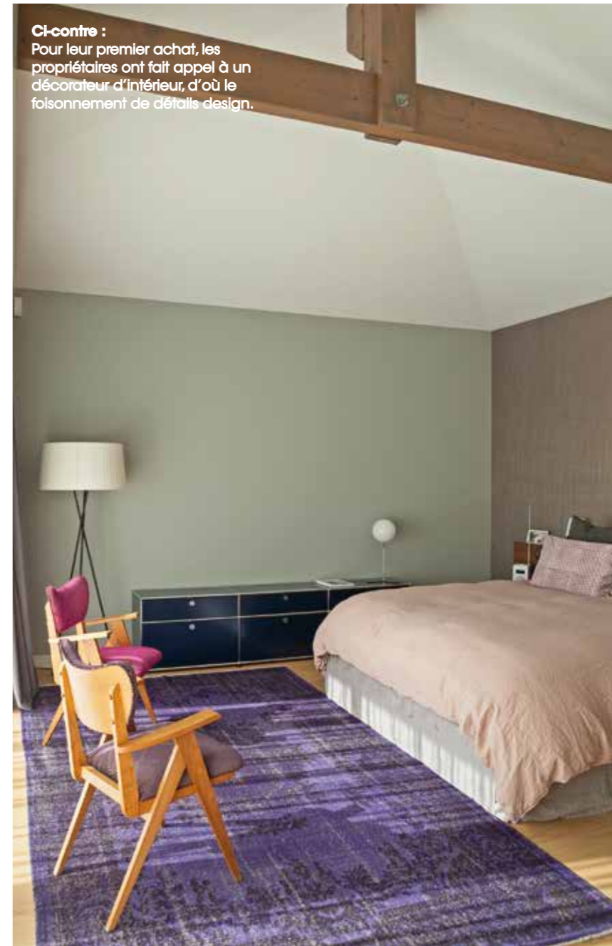
Ci-contre : Pour leur premier achat, les propriétaires ont fait appel à un décorateur d'intérieur, d'où le foisonnement de détails design.